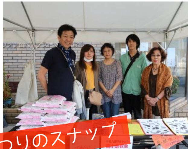
前回の連合まつりのスナップ