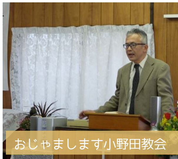
おじゃまします小野田教会

今年度は11月に大分地区、来年2月に遠賀川地区での開催を予定しています。日程が決まり次第、随時お知らせいたします。