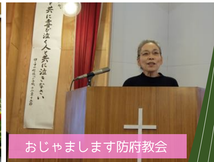
おじゃまします防府教会